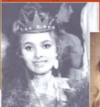
Анжелика Агурбаш (Лица Ялинская) – первая Мисс Беларусь.