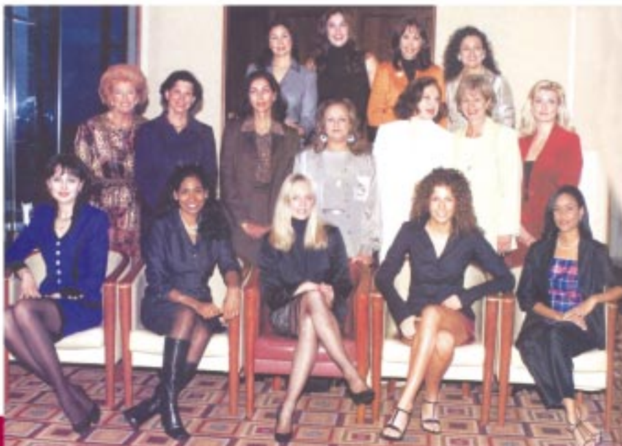
Встреча Мисс Мира разных лет на 50-летию конкурса.