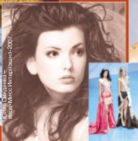
Юлия Синдеева — вице-Мисс Интернешнл-2007.