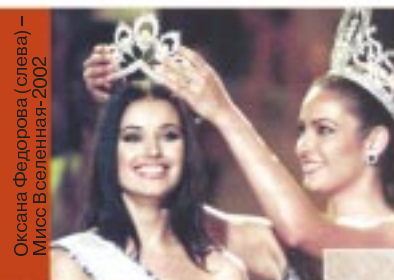
Оксана Федорова (слева) – Мисс Вселенная-2002